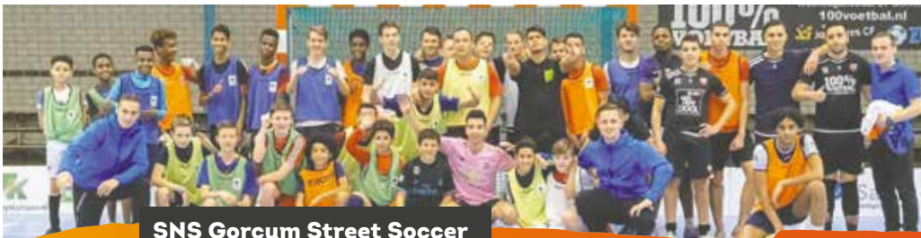
SNS Gorcum Street Soccer